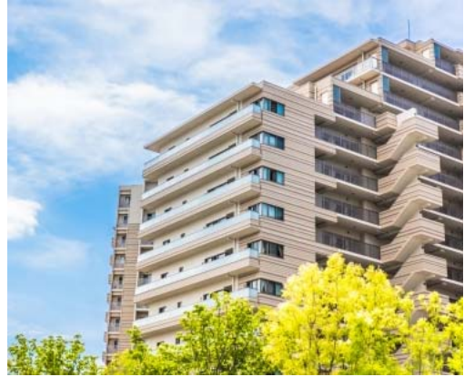
マンション大規模修繕の工事費用を透明化

そんな中で注目されているのが、日本R M協会が薦める、費用や工事内容を透明化する「価格開示方式（RM方式）」です。原価や業者の利益まで開示し、第三者的なアドバイザーの助言も受けられます。今回、RM方式についての無料セミナーを開催。大切な修繕積立金の適正利用のためにも、ぜひご参加を。