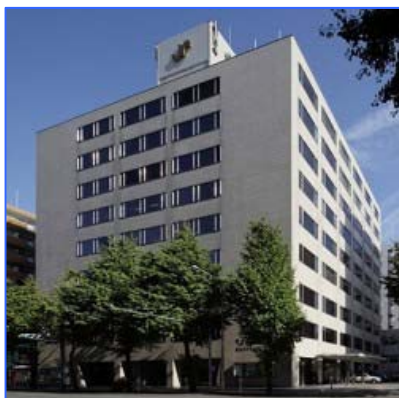
【福岡商工会議所 地図】